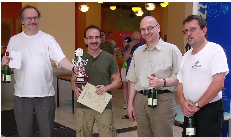
2008 Blitzschach-Sieger USG Chemnitz