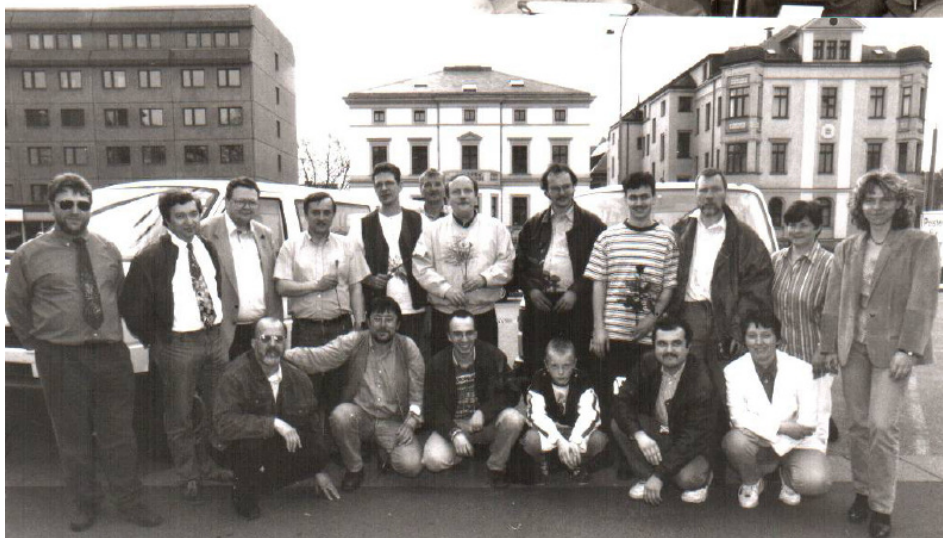
1997 USG Aufsteiger in die 1. Bundesliga mit begeisterten Schachanhängern