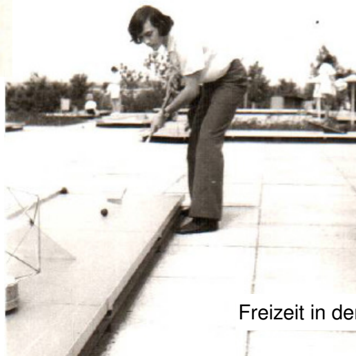
Freizeit in den 1970 er Jahren ...