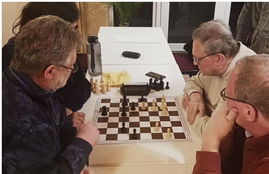
Zwei Hirne und zwei Hände in Aktion.